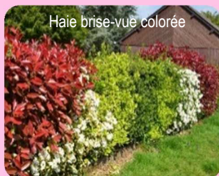
Haie brise-vue colorée