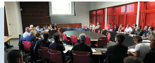
LES ÉLUS ET TECHNICIENS RÉUNIS POUR LA MATINÉE D'ÉCHANGE

Cette matinée, riche en échanges, a réuni 46 participants représentant 23 collectivités.